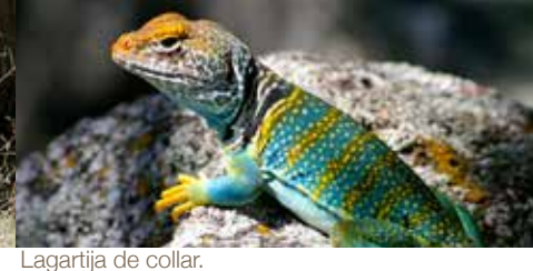
Lagartija de collar.