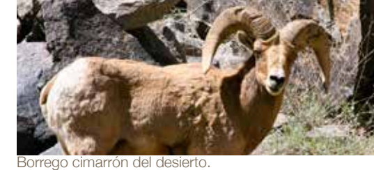
Borrego cimarrón del desierto.