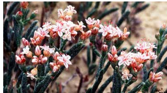
Alforfón salvaje aficionado de la arcilla.

Iomatium Delta, el cactus hookless de Colorado, el urogallo de las artemisas de Gunnison, el águila calva, el murciélago manchado, la nutria de río y el zorro veloz.